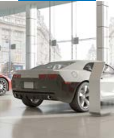
Dlažba položená s použitím Mapetex Systemu