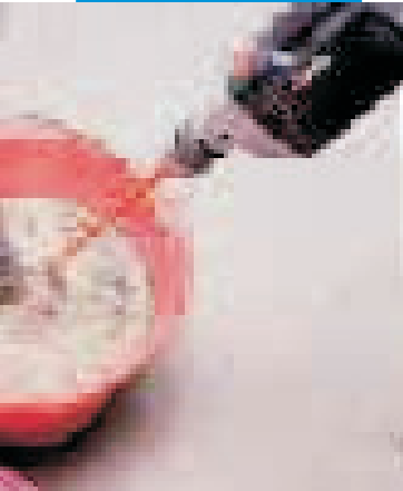
Směs Adesilex P4

V čisté nádobě smíchejte 25 kg Adesilexu P4 (1 pytel) s 5 až 5,5 litry vody. Míchejte tak dlouho, až vznikne dokonale hladká směs bez