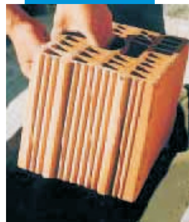
Vložení cihelného bloku do Adesilexu P4