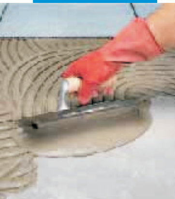
Nanášení pomocí stěrky s polokruhovými zuby