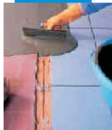
Vyrovňování povrchu staré podlahy pomocí Adesilexu P4