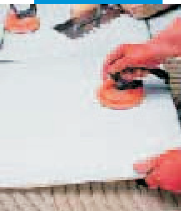
Lepení dlaždic velkého formátu